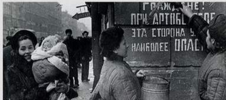
На Невском проспекте