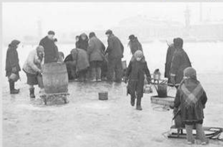
Пункт водоснабжения на Неве