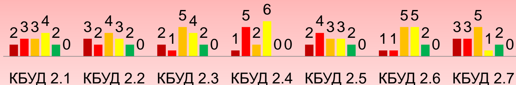
Распределение учащихся 3-х классов (15 чел.) по средним баллам оценки сформированности БУД по результатам диагностики на декабрь 2020 года

■ Балл 0 ■ Балл 1 ■ Балл 2 ■ Балл 3 ■ Балл 4 ■ Балл 5