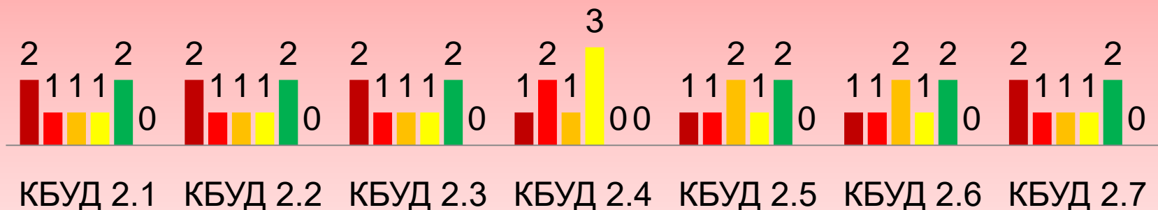
Распределение учащихся 3а класса (7 чел.) по средним баллам оценки сформированности БУД по результатам диагностики на декабрь 2020 года

■ Балл 0 ■ Балл 1 ■ Балл 2 ■ Балл 3 ■ Балл 4 ■ Балл 5