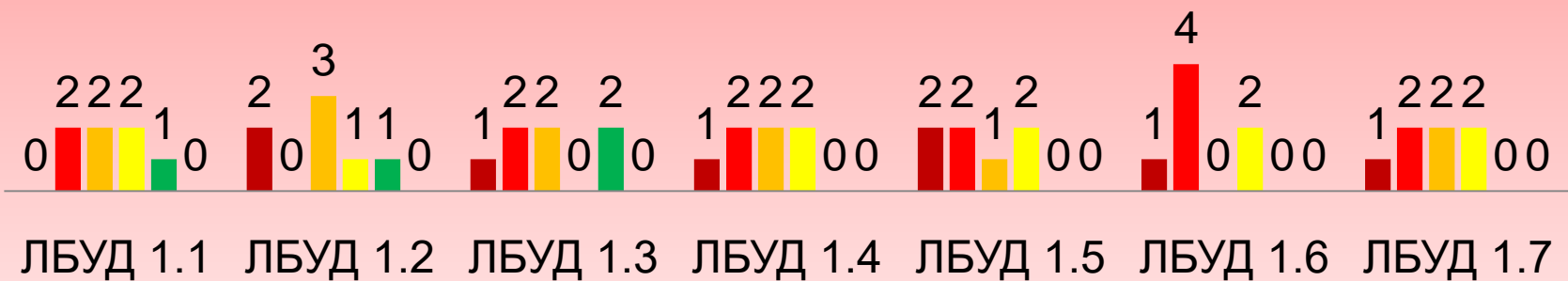
Распределение учащихся 3а класса (7 чел.) по средним баллам оценки сформированности БУД по результатам диагностики на декабрь 2020 года

■ Балл 0 ■ Балл 1 ■ Балл 2 ■ Балл 3 ■ Балл 4 ■ Балл 5